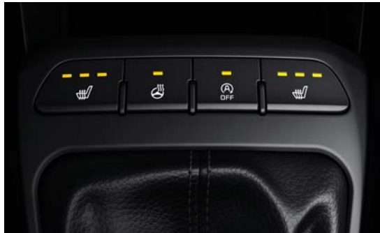
Sitzheizung vorne sowie Lenkradheizung