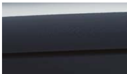
EU3 - Smoke Blue 2