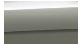
URG - Urban Green 2