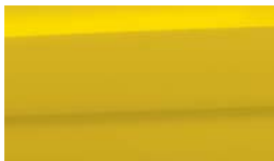
MYW - Most Yellow 2