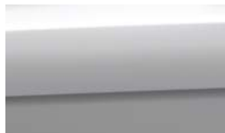
4SS - Silky Silver 2