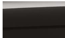
ABP - Aurora Black 2