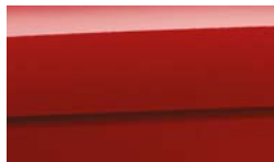
BEG - Signal Red 2