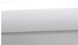
UD - Clear White 1