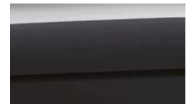
ABT - Platinum Graphite 2