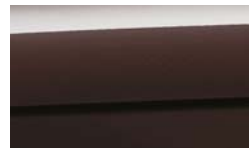
SEN - Deep Sienna Brown 2